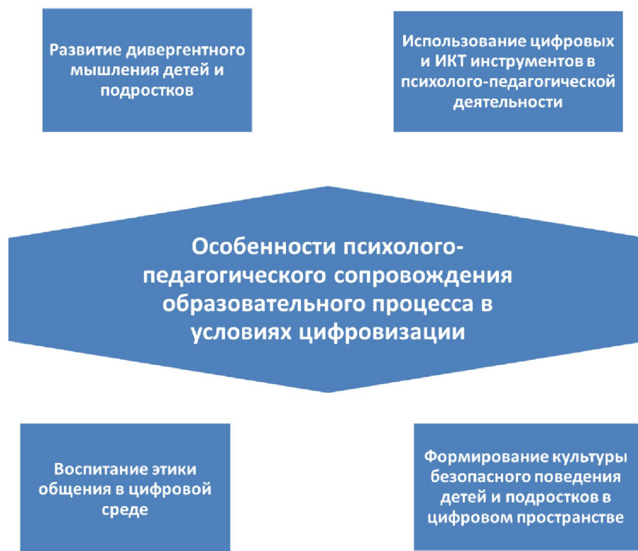
Рис. 1.3.1. Особенности психолого-педагогического сопровождения образовательного процесса в условиях цифровизации

Реализация ОПОП основана на широком применении цифровых инструментов психолого-педагогической деятельности: